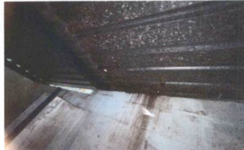
Foto 2: Techo de los baños con agujeros por donde se filtra el agua.