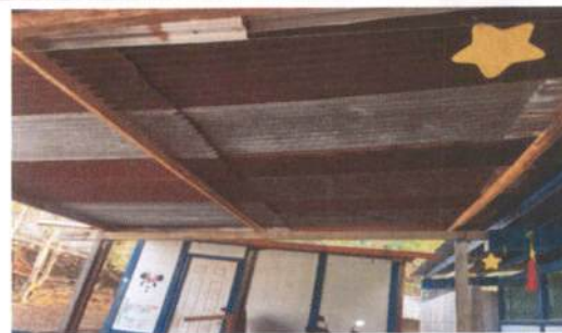
Foto 6: Techo del corredor de la escuela con lámina deteriorada y con estructura de madera.

Observación: Si es necesario se pueden agregar hojas adicionales y actualizar el número de hojas.