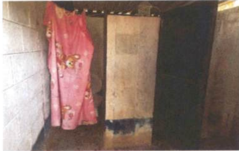
Foto 1: Puertas de los baños de niñas en total deterioro, previo a iniciar los trabajos de remozamiento.