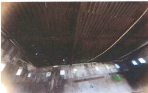
Foto 3: Techo de la cocina con lámina deteriorada y estructura de madera en mal estado.